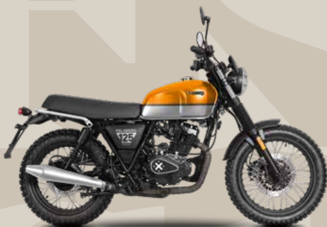
CALIFORNIA ORANGE / TIMBERWOLF GREY GLOSSY