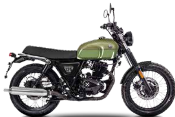
ARMY GREEN/OLIVE GREEN