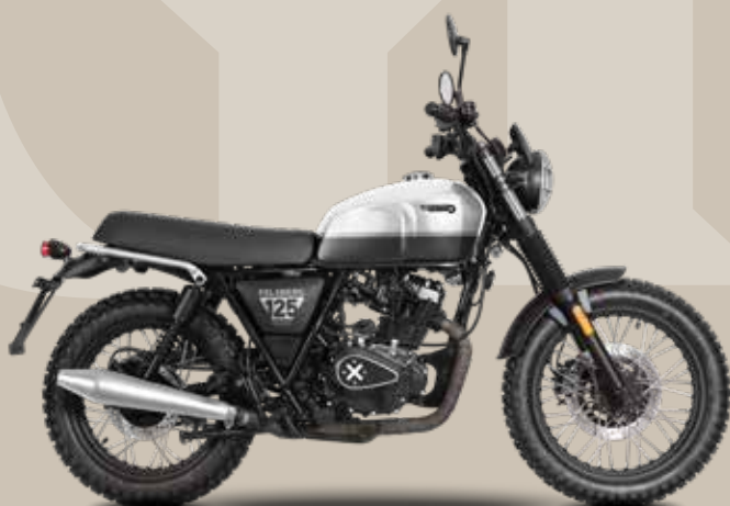
ARCTIC WHITE / BACKSTAGE BLACK GLOSSY