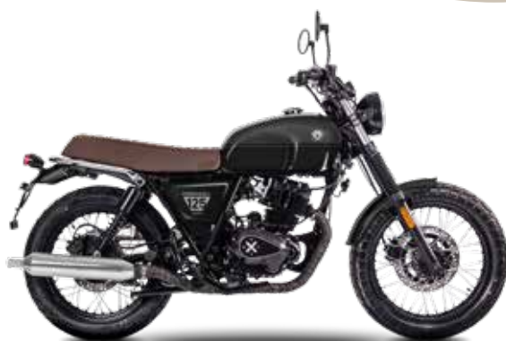
BACKSTAGE BLACK / TITAN BLACK

Doch die Cromwell 125 sieht nicht nur gut aus, sie kann auch was. Mit Scheibenbremsen, LED-Licht und moderner Einspritzung ist sie technisch auf Augenhöhe – zuverlässig, unkompliziert, bereit für jeden Tag. Ihr ruhiger Viertaktmotor nimmt Ampeln gelassen und kurvige Nebenstraßen mit einem Lächeln.