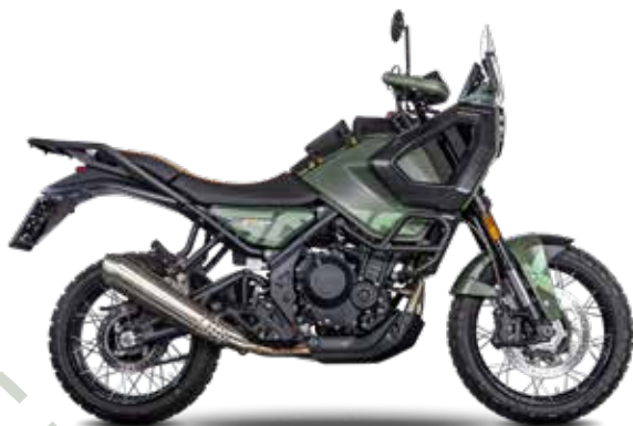
SAGE GREEN MATT

* gemäß den Anforderungen der Delegierten Verordnung (EU) 134/2014 der Kommission, Anhang VII