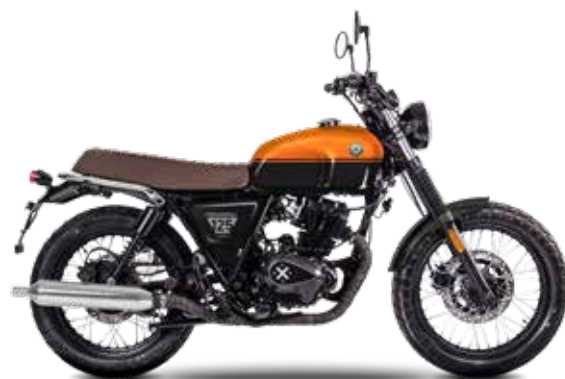
CALIFORNIA ORANGE / TITAN BLACK